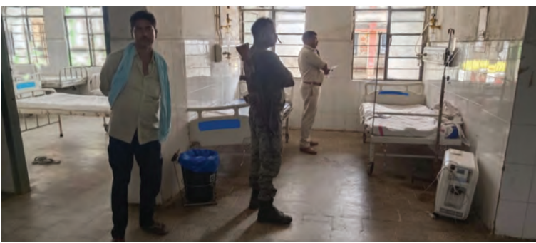
अस्पताल परिसर में मौजूद पुलिस बल