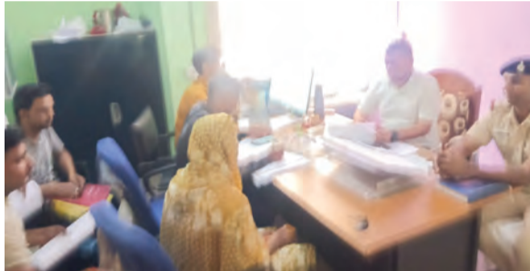
जनता दरबार में उपस्थित पदाधिकारी एवं अन्य

अंचलाधिकारी ने बताया कि जनता दरबार में कुल चार फरियारियों ने आवेदन प्रस्तुत किया था। सभी मामलों में दोनों पक्षों को नोटिस भेजकर उपस्थित होने के लिए बुलाया गया था। सुनवाई के दौरान दोनों पक्षों के दस्तावेजों का अवलोकन एवं तथ्यों की जांच की