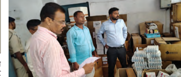
अस्पताल का निरीक्षण करते एसडीएम

अनुमंडल पदाधिकारी ने अस्पताल परिसर की स्वच्छता व्यवस्था का अवलोकन किया। वार्ड, शौचालय और परिसर की सफाई देखी। उन्होंने संबंधित अधिकारियों एवं कर्मियों को साफ-सफाई बनाए रखने के लिए आवश्यक निर्देश दिए। कक्षा के अस्पताल में गंदगी किसी भी स्तर में बर्दाश्त नहीं की जाएगी। इसके अतिरिक्त एसडीएम ने दवा भंडार का भी निरीक्षण किया। उन्होंने आवश्यक औषधियों