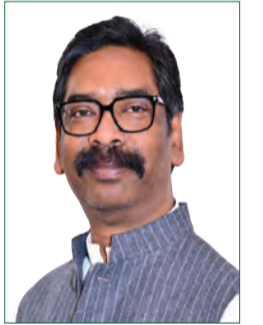
हेमन्त सोरेन मुख्यमंत्री, झारखण्ड