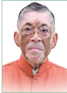
संतोष कुमार गंगवार राज्यपाल, झारखण्ड