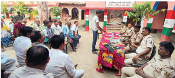
जनसंवाद गोष्ठी में शामिल पुलिस व ग्रामीण

बाद पीसीसी ढलैया का निर्माण होना है, लेकिन इस कच्ची सड़क वाले हिस्से पर संबंधित रैयती परिवार का मालिकाना हक है और उन्होंने वहां पर सड़क निर्माण कार्य रोक रखा है, क्योंकि उनका कहना है कि जब तक उन्हें सरकार की ओर से भूमि का उचित मुआवजा नहीं मिल जाता, तब तक वे निर्माण कार्य आगे नहीं बढ़ने देंगे। उन्होंने यह भी स्पष्ट किया कि मुआवजे की मांग से संबंधित आवश्यक दस्तावेज और आवेदन पहले ही अंचल कार्यालय के पास भेजे जा चुके हैं, जिसके बाद यह मामला न्यायालय के समक्ष भी गया था, जबकि दूसरी तरफ से बातचीत में यह बात सामने आई कि न्यायालय