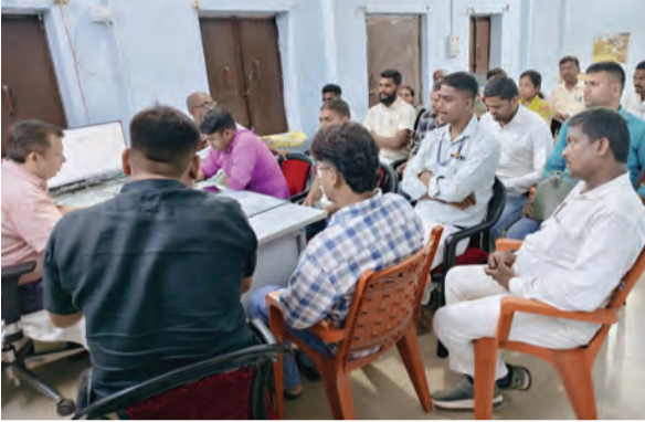
कार्यालय में बैठक के दौरान बीडीओ के साथ मुखिया व पर्यवेक्षक

में शौचालय निर्माण के लिए लोगों को प्रेरित करने को कहा गया। नए बनाए गए शौचालयों की प्रोत्साहन राशि भुगतान के लिए लाभुकों को